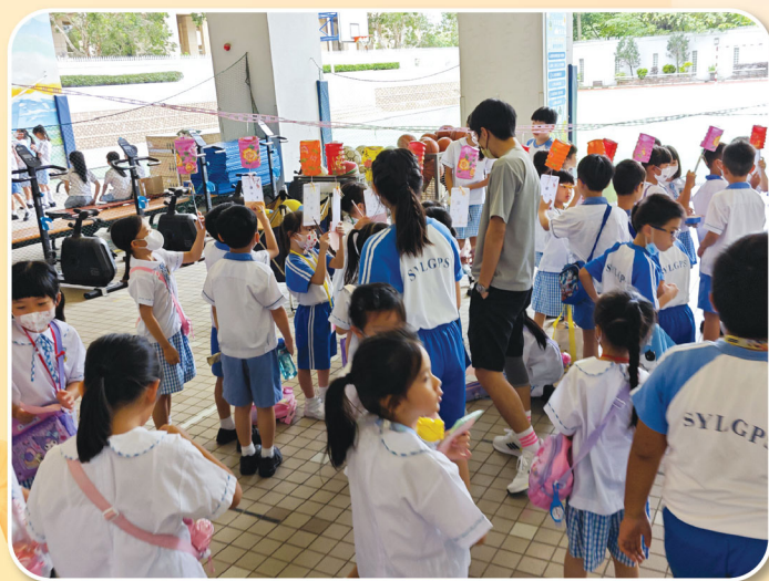
同學們踴躍參與猜燈謎遊戲，現場氣氛熱烈。