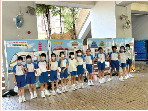
體育科老師講述新時代的中國力量及中國精神