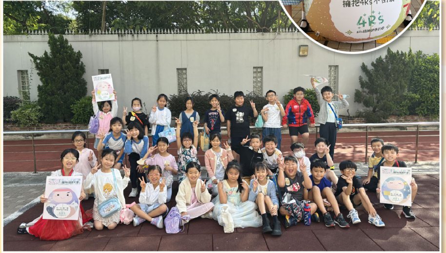
「4Rs不倒翁」鍛鍊學生「不倒」的精神