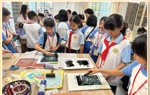
同學們與興寧市第一小學的同學們一起動手體驗版畫、剪紙、書法課程，氣氛融洽。