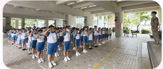
風紀們進行步操訓練，動作齊整一致，表現得精神抖擻！