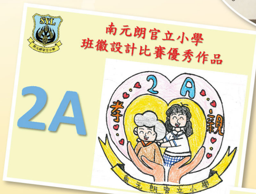
南元朗官立小學 班徽設計比賽優秀作品