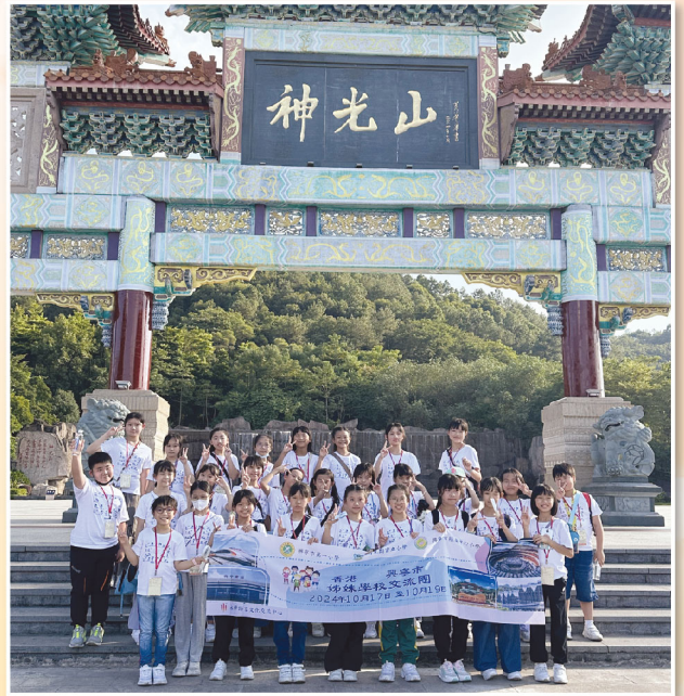
同學們一起遊覽神光山國家森林公園，飽覽興寧市的景色。