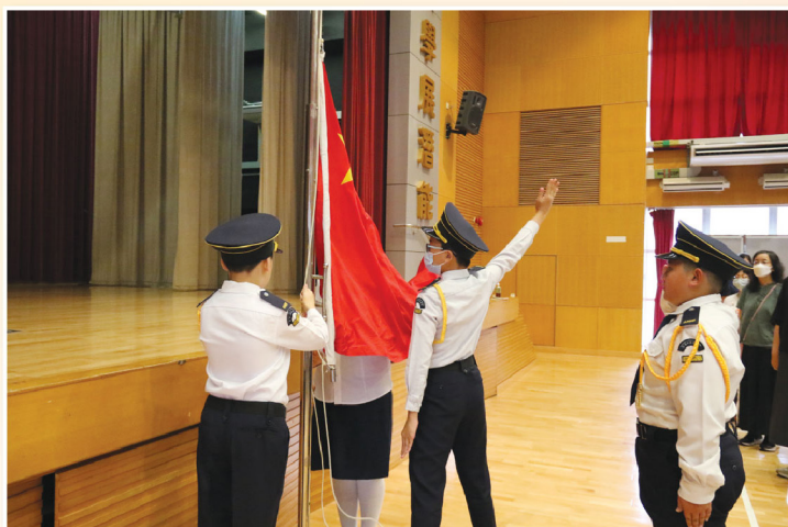
國旗在雄壯的國歌聲中緩緩升起