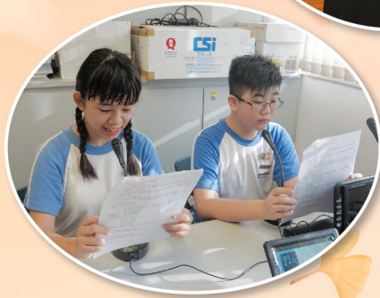
「憲基大使」進行晨光廣播，主題是「升國旗的禮儀」。