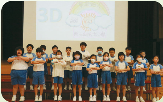
每位學生認真投入，表現出團結精神。