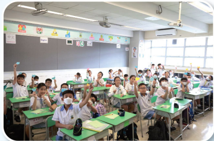
同學們展示自己對老師的「愛」