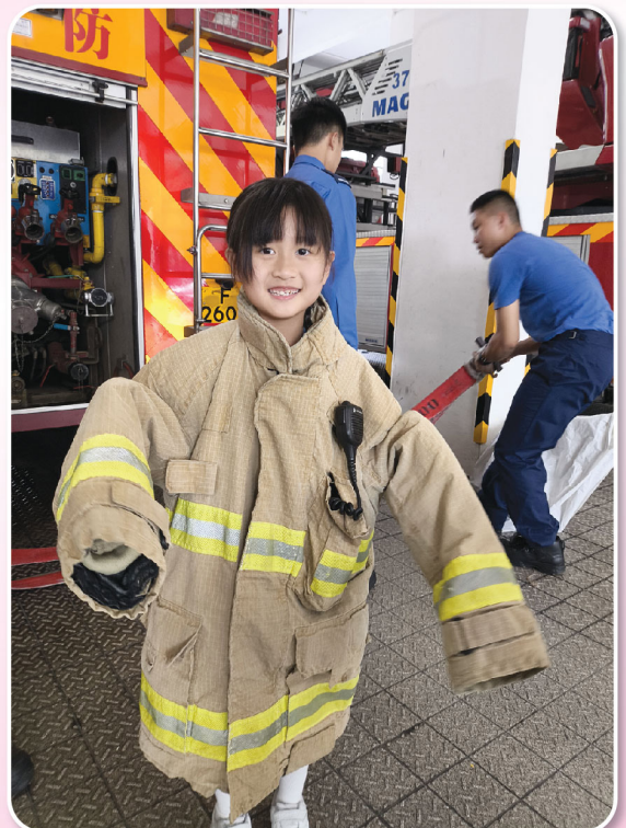
同學穿起消防員的制服寸步難移，真渴望可以快高長大！