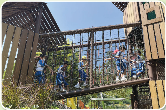
你看，學生們結伴攀上繩網，真厲害啊！