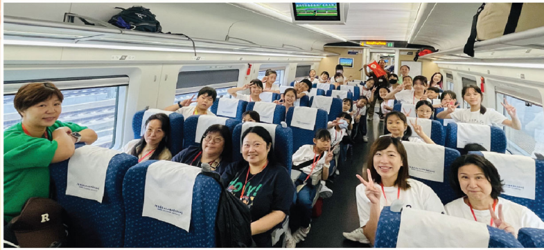
吳校長、帶隊老師、隨團家長和同學們乘搭高鐵前往梅州興寧市，心情非常雀躍。

為了讓學生認識中國文化，學校在2024年10月17日至19日帶領28位音樂校隊同學到訪廣東省興寧市，與兩所姊妹學校(興寧市第一小學、興寧市徑南中心小學)的學生作音樂表演及交流活動。透過互助觀摩及學習交流，兩地姊妹學校的師生感情得以增長，學生能體驗當地文化，擴闊學習視野，並認識國情與國家教育的發展。