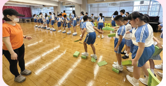
「過橋抽板」提升風紀們的協作能力，大家都玩得非常投入呢！

為了啟發風紀的領袖潛能和團結精神，訓輔組於9月5日進行第一次風紀訓練。透過各個活動和小比賽後作共同反思，讓風紀了解在日後如何解難和團隊合作的重要性。