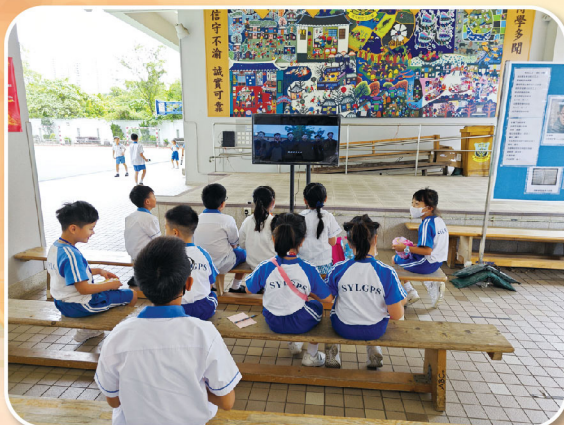
918事變紀念活動：視頻播放和展覽