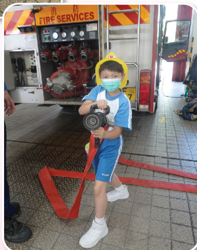
同學戴上消防帽及拿起喉管，看起來十分英偉。