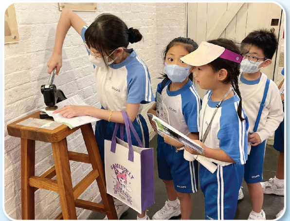
同學列隊等候於紙張上壓印，既期待又興奮！

此外，由於二年級上學期常識科課程需認識社區設施，本校於10月份安排全級學生參觀元朗消防局，藉此讓學生了解消防員的工作及增加防火知識。