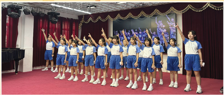
同學們為大家獻唱，充滿動感的演出令現場觀眾掌聲雷動，為內地師生帶來不同凡響的音樂體驗。