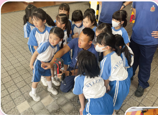
消防員示範如何使用生命探測儀器，同學們都感到十分好奇。

此外，由於二年級上學期常識科課程需認識社區設施，本校於10月份安排全級學生參觀元朗消防局，藉此讓學生了解消防員的工作及增加防火知識。