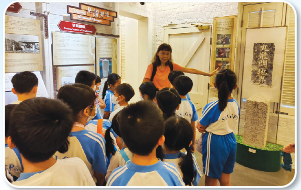
老師耐心講解展館資料，同學專心聆聽，虛心學習。