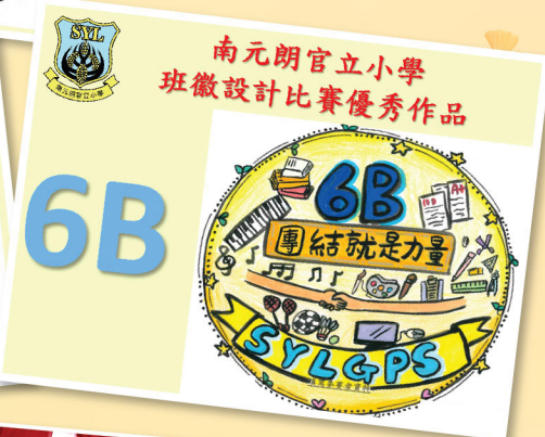
南元朗官立小學 班徽設計比賽優秀作品