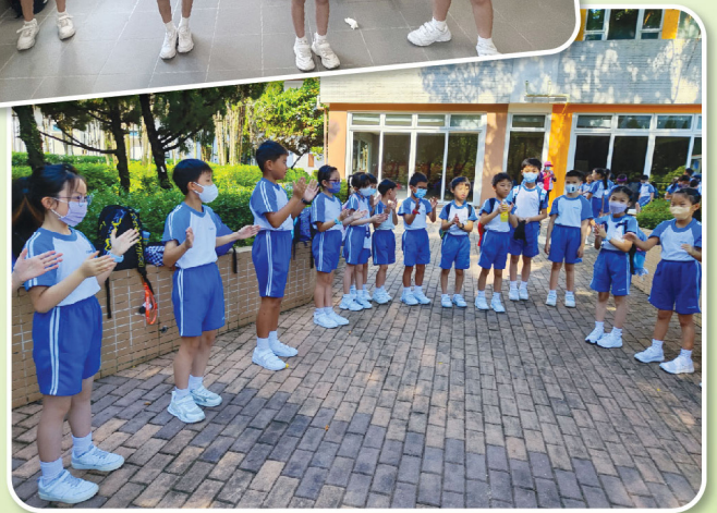
同學們玩集體遊戲時可以培養良好的默契