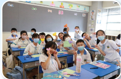
同學們認真地完成送給老師的點唱紙和敬師卡