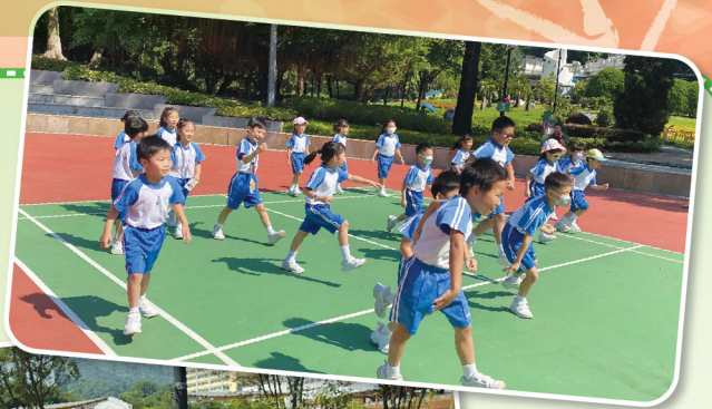
大家齊準備：「狐狸先生幾多點？」

2024年10月8日(星期二)是本年度學校旅行舉行的日子，一年級學生與家長到屯門公園親子遊，二至六年級學生到保良局賽馬會北潭涌度假營郊遊。旅行當天，天公造美，郊外空氣清新，景色怡人，師生與家長一起暢遊，享受大自然之美，其樂融融。