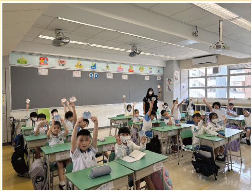
給老師、同學、好朋友和自己送贈「打氣心意卡」