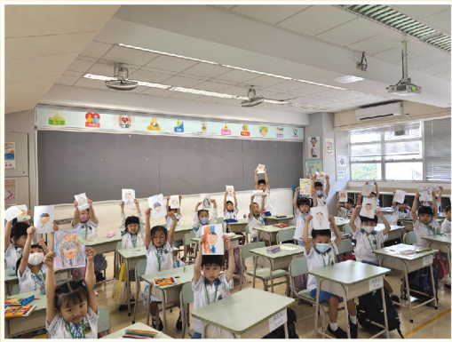
新入學的小一學弟學妹互相認識