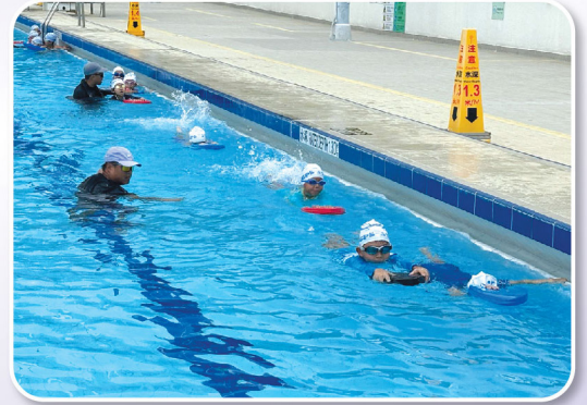
同學以分組的形式進行練習

學校提供游泳基礎課程，不僅讓同學們學會一項重要的生活技能，還能促進他們的體能發展和團隊合作精神。每年的水運會更是同學們展示訓練成果的絕佳平台，他們可以通過比賽來提高自己的技術，體現出自己的實力。