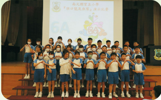
學生的演出精彩，維肖維妙。

為了加強學生對學校的歸屬感和同學間的凝聚力，訓輔組舉行了「班口號」演示比賽。學生積極參與，團結一致，他們亦衷心感謝老師當中的帶領及指導。