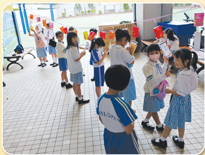
同學們專注而認真地投入在猜燈謎遊戲中