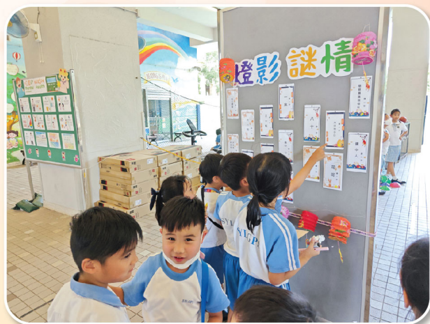
你知道答案嗎？可否給我一些提示？

918事變是中國歷史上的一個重要事件，紀念活動包括視頻播放和展覽，更有918事變歷史事件、影響配對遊戲。這一連串活動讓同學了解歷史的教訓，並反思和平的重要性。