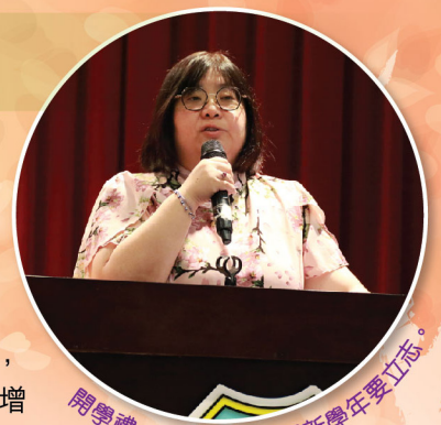
開學禮，校長勉勵我們新學年要立志。

9月16日進行了一次晨光廣播，主題是升國旗的禮儀，在學校生活中實踐有「禮」的好行為。