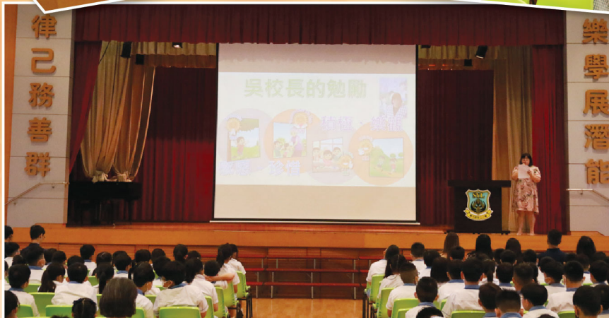
開學日暨「全港同『諾』禮」