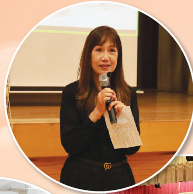
夏副校進行有關國慶節主題的國旗下講話