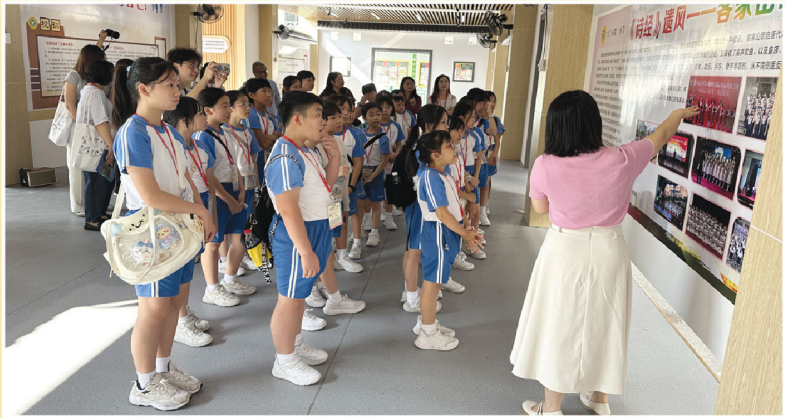
興寧市第一小學的老師帶領同學參觀校園的校長長廊