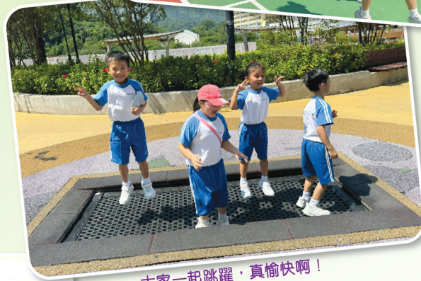
大家一起跳躍，真愉快啊！