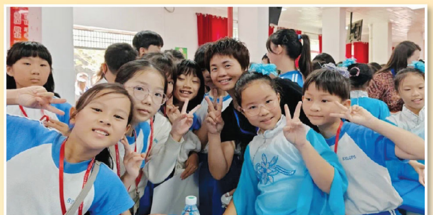
同學們與內地學生成為新朋友，記錄相聚的快樂時光。