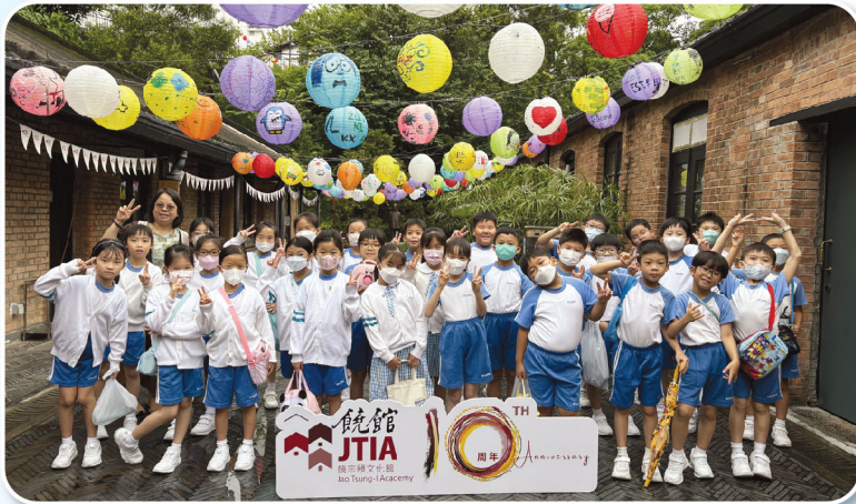
老師帶領同學於「中秋花燈大會」下合照，留下美好回憶。