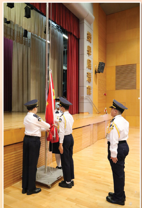
升旗隊按程序，一絲不苟地進行升國旗。