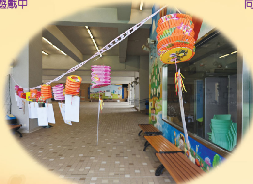
傳統花燈展覽配以猜燈謎遊戲