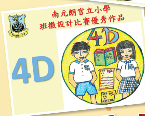
南元朗官立小學 班徽設計比賽優秀作品