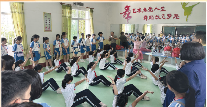
同學們參觀興寧市徑南中心小學的校舍，走進音樂、舞蹈和藝術課堂，並現場分享才藝。