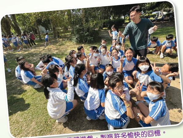
師生一起進行集體遊戲，製造許多愉快的回憶。