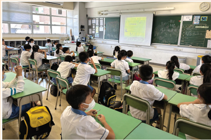
同學們對《巴黎奧運・趣聞篇》看得不亦樂乎