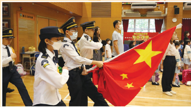
升旗隊雄糾糾氣昂昂的進入會場