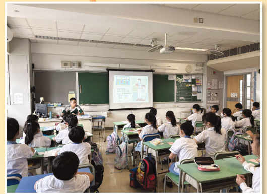
新學年，大家都開始訂立新目標。