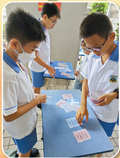
配對遊戲讓同學了解歷史的教訓，了解和平的重要性。