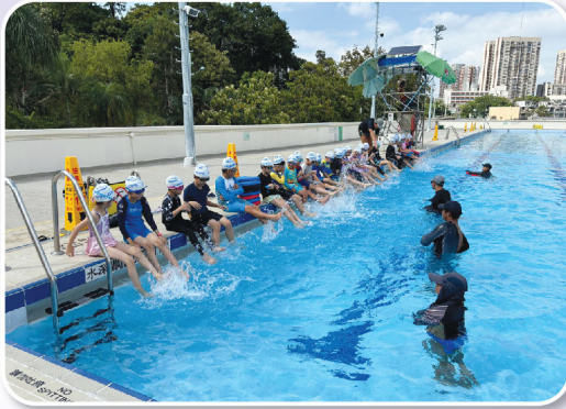
全班同學一同參與游泳訓練是一個很難得的體驗

本校重視學生有多元發展，鼓勵同學每天做運動。本校在三年級的體育課中加入游泳課，教授學生水上安全知識和游泳技巧，不僅可以提高學生的安全意識，還可以強身健體，並培養學生對游泳的興趣。