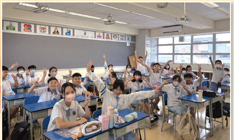
一張張溫暖的笑臉，一句句關懷的祝福又再次湧現。