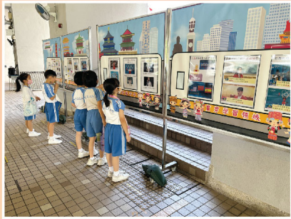
同學們結伴欣賞「巴黎奧運・中國與香港」主題展板