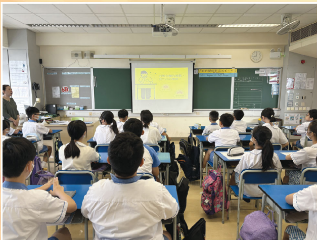
新學期剛開始，我們的助右銘——「好的開始是成功的一半」。