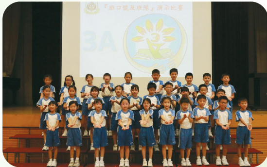
同學落力演出，生動活潑。