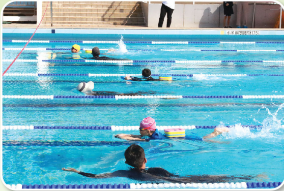
各項比賽的健兒都鬥得難分難解

本年度水運會於2024年10月25日順利舉行，當天天朗氣清，各級健兒齊聚一堂，共襄盛舉。在比賽中，各位「小飛魚」都展現了「勝不驕，敗不餒」、「友誼第一，比賽第二」的體育精神。本年度的游泳比賽圓滿結束，大家不但增加了豐盛的學習經歷，也加深了彼此之間的友誼，大家期待明年再見！