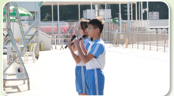
運動員代表同學宣誓，於比賽中實踐「南兒修為」和體育精神。