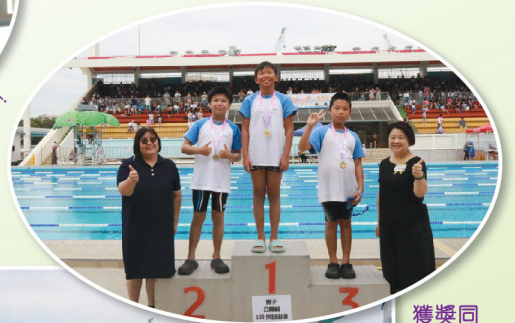
獲獎同學與頒獎嘉賓拍照留念