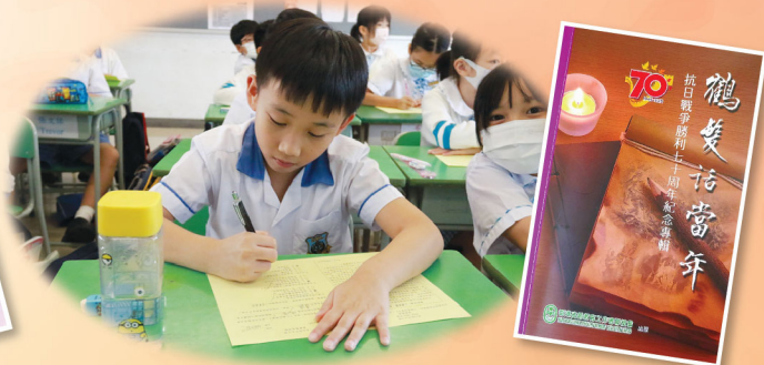
《鶴髮話當年》文章選讀及延伸活動