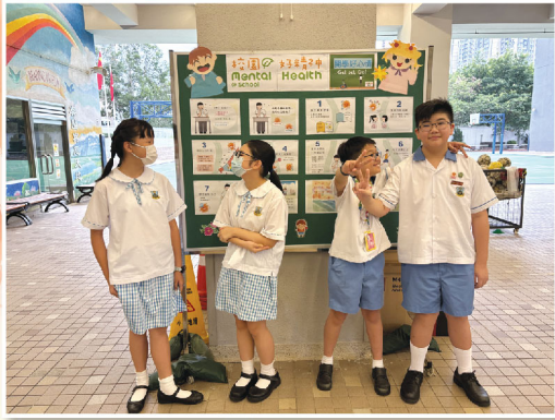
開學好心情@童聲齊互勉