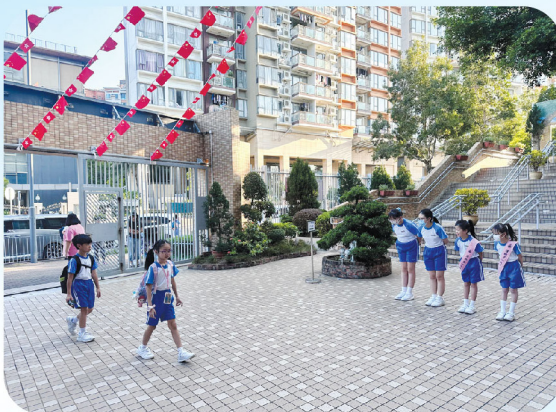
禮貌愛心天使主動跟師生說聲「早安」，培養同學注重禮貌的習慣。

為了在學校表現關愛有禮，讓學生實踐好行為，作好榜樣，「禮貌愛心天使隊」的隊長和隊員通過服務及訓練來提升自我形象並培養服務精神。