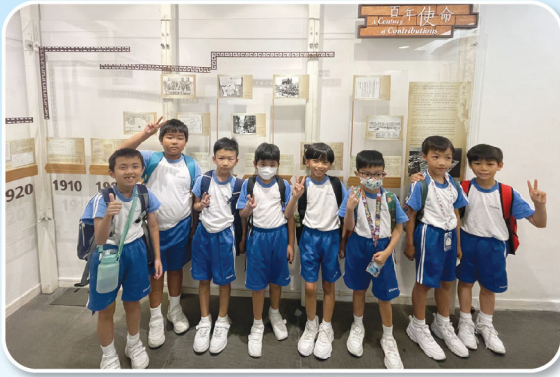
同學認真了解香港百年歷史的變遷，於展板前留下倩影。

為了配合常識科課程的單元教學內容，本校於9月份安排三年級學生參觀饒宗頤文化館，藉此增加學生對中華文化的認識，提升藝術及文化修養。