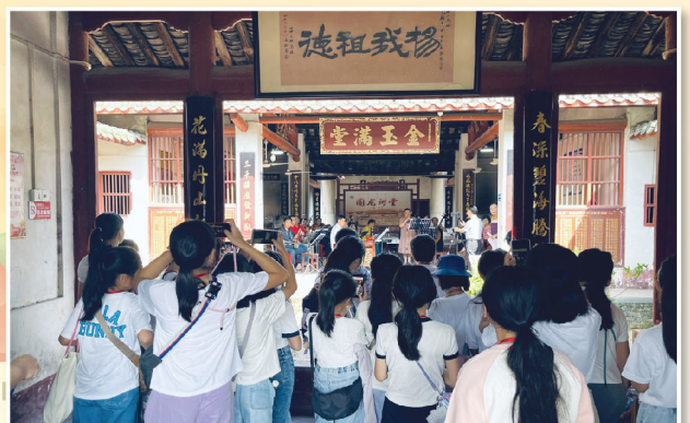
旅程的最後一天，同學們處身在「九廳十八井」，認識客家民宅的典型建築及生活特色。