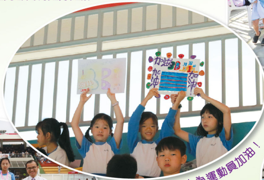
同學在觀眾席上為運動員加油！