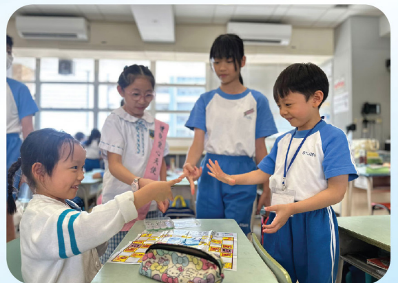
禮貌愛心天使與學弟學妹一起透過下棋建立友誼。