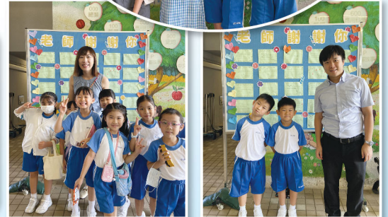
同學和老師在充滿「愛」的敬師卡前拍照留念