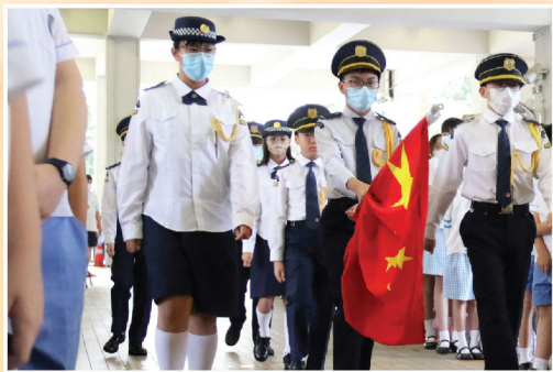
升旗隊整齊的步操