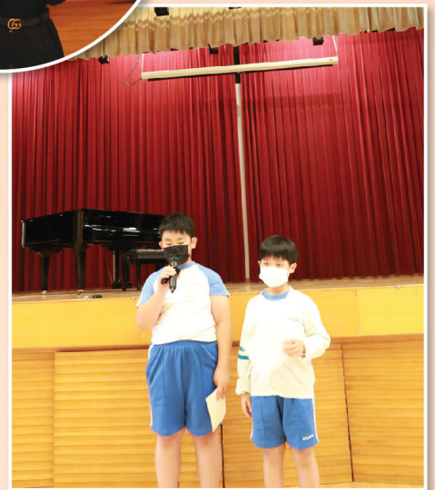
「憲基大使」進行國旗下講話，主題是「認識中央駐港機構」。