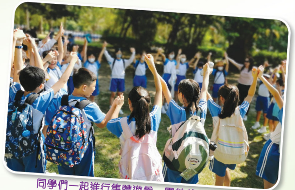
同學們一起進行集體遊戲，團結就是力量。