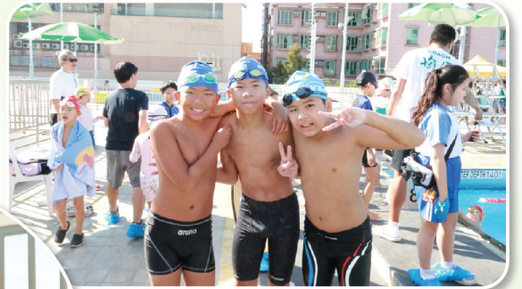
「友誼第一，比賽第二。」