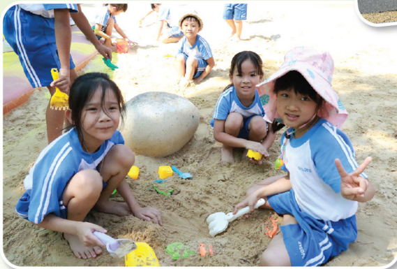
大家一起愉快地堆沙