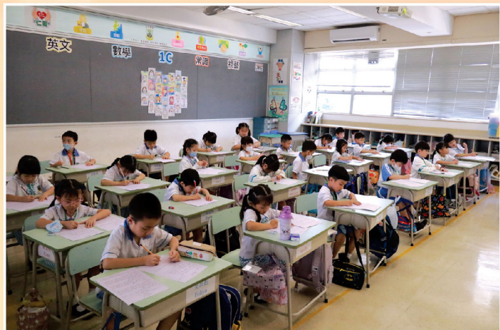
《天上的星星不簡單》有聲繪本及延伸活動